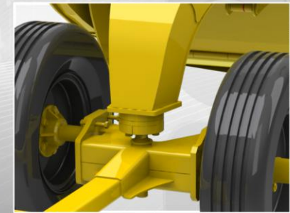
SISTEMA DE AVANTRÉN ARTICULADO POR RÓTULA