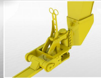
LANZA TIPO CUELLO CON SISTEMA ARTICULADO